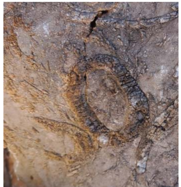
Poprečni presjeci su najčešći