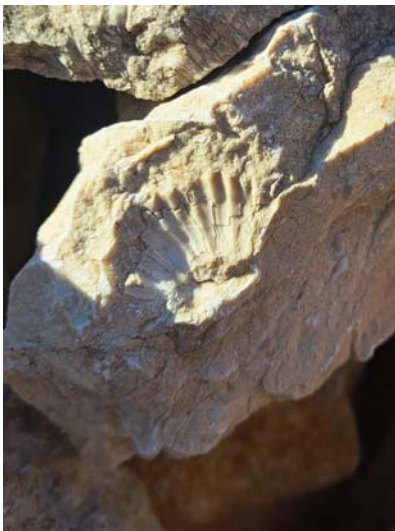
Otisak školjke koja je ispala