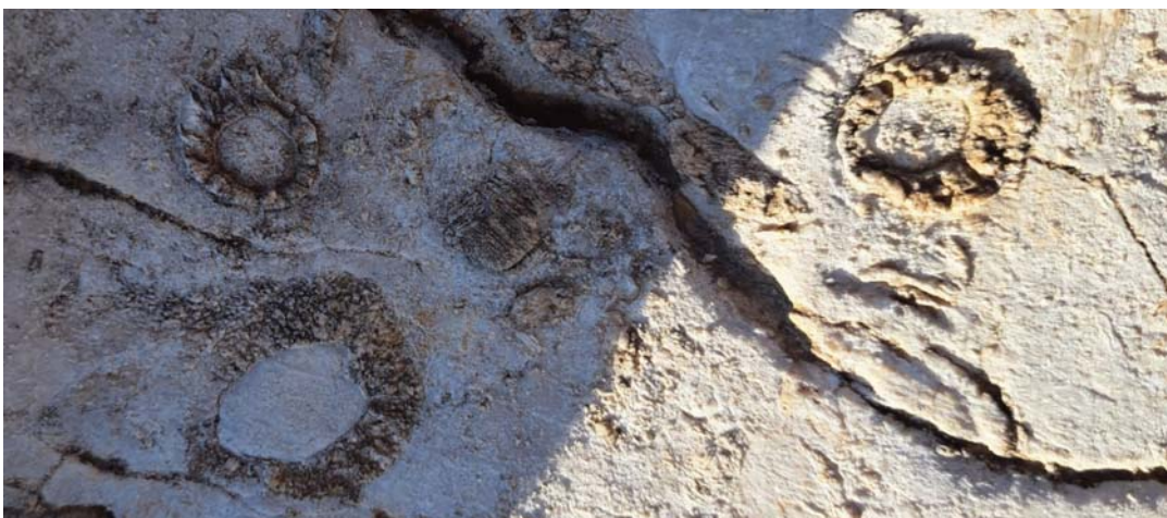
Živjele su u zajednicama