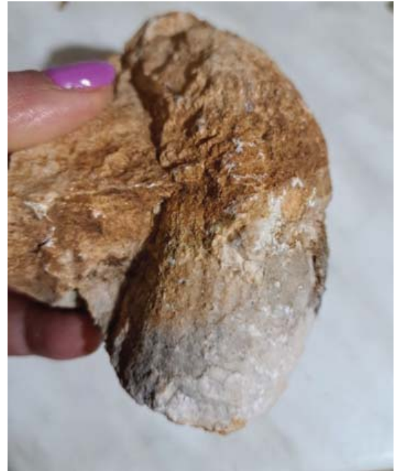
Hippurites ( Vaccinites vesiculosus Woodward) – Rogljast oblik