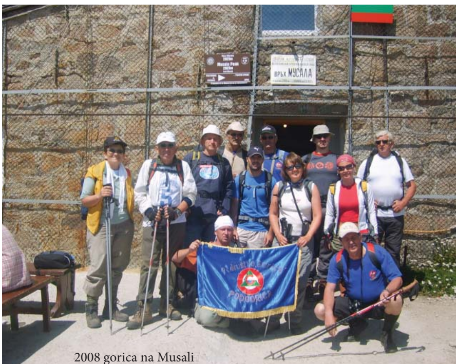
2008 gorica na Musali

učesće na planinarskim manifestacijama i takmičenjima. Sve je ovo omogućeno dobrovoljnim angažmanom naših vodiča koji ulažu veliki trud da bezbjedno i organizovano povedu grupu u planinu. Razni profesionalni profili i afiniteti naših članova iskorišteni su za brojne druge aktivnosti koje idu uz planinarstvo kao što su fotografija, pisanje, kartografija, izdavanje vodiča i flajera, izrada projekata, markiranje i održavanje staza, elektronsko uređenje biltena i održavanje sajta Kluba, poznavanje planinske flore i faune, ishrana u prirodi, održavanje zdravlja i zdravih stilova života.