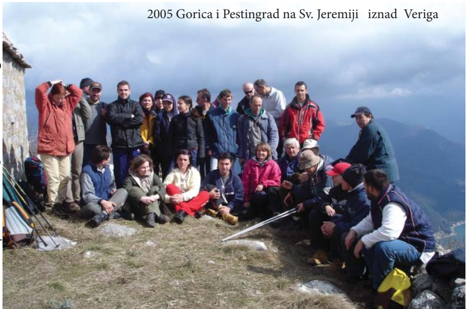
2005 Gorica i Pestingrad na Sv. Jeremiji iznad Veriga