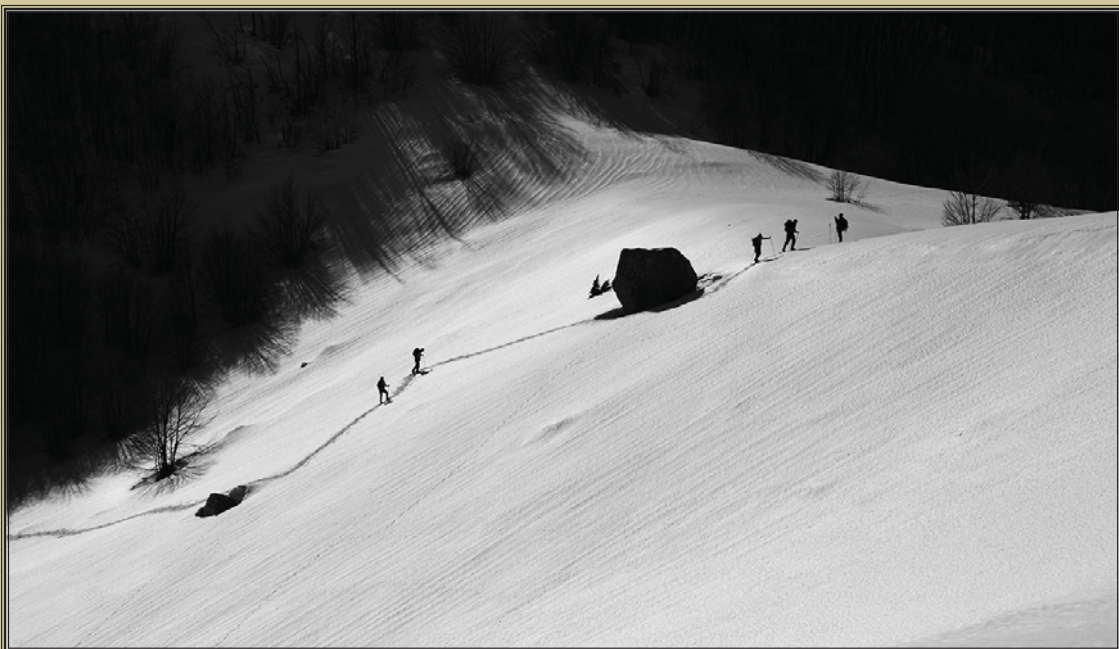
BUKUMIRSKO JEZERO I OKOLINA - fotografije: Radojko Bošković