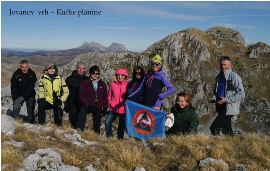
Jovanov vrh – Kučke planine