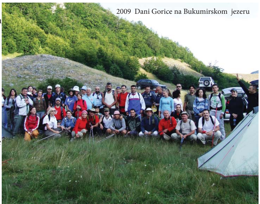
2009 Dani Gorice na Bukumirskom jezeru