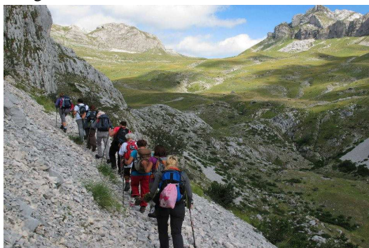
Od Pošćenja do Dobrog dola