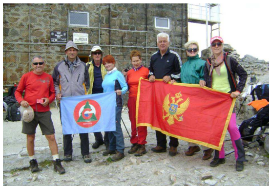
Na vrhu Musala, Rila

U nastavku "ekspedicije" u Bugarskoj članovi PK "Gorica", njih osmoro, osvojili su 16. juna najviši vrh Balkana Musalu (2925 mnm) na planini Rila. Narednog dana kompletna ekipa je posjetila Rilski manastir, jedan od najznačajnijih bugarskih manastira i obišla najznačajnije znamenitosti u centru Sofije.