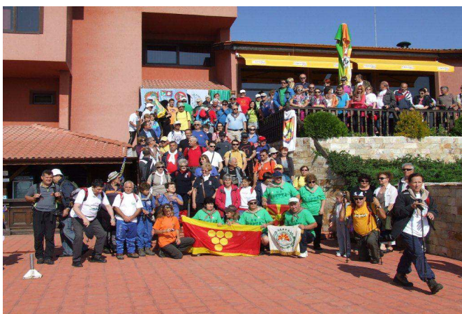
Učesnici 16. susreta ispred odmarališta na Bistrici

Preko 150 planinara iz sedamnaest klubova – društava iz Srbije, Makedonije, Crne Gore, Slovenije i Bosne i Hercegovine i domaćina Bugarske trodnevno druženje iskoristili su za razmjenu iskustava i dogovora za buduću saradnju i zajedničke planinarske aktivnosti.