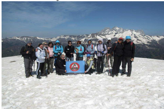
Crna planina, Komovi u pozadini