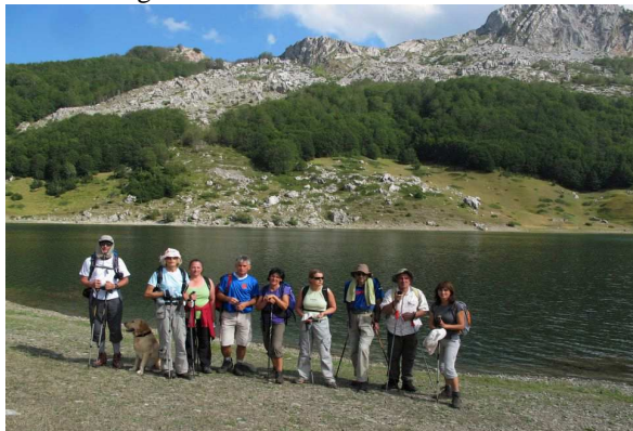
Na Rikavačkom jezeru

Lijepi nazivi za dva prelijepa vrha Kučkih planina koja nismo prečesto osvajali, ali koja su ove godine za one malobrojne ostala u lijepom sjećanju, i koja će zbog toga biti ponovljena u kalendaru akcija za ovu godinu. Oba sa imponantnom visinom od 2093m i 2009m, Vila na sjeveroistočnom kraju i granici prema Albaniji, a Viljenica na jugu u nizu vrhova koji idu od Žijova do Huma Orahovskog.