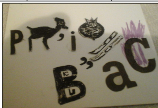
Rebus - autor Rajko Mičković