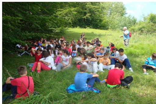
Sa djecom na Planinici—Veruša

Drugo predavanje održano je 7.07.2013. u Dječjem odmaralištu na Veruši za oko 70-tak djece koji su tada bili u smjeni, također iz viših razreda osnovnih škola iz Podgorice. Predavanje je održano na isti način, a nakon predavanja organizovana je šetnja iznad odmarališta, padinama Planinice, uglavnom šumskim stazama u trajanju od 2 i po sata. Tokom šetnje djeci smo objašnjavali pravila ponašanja u grupi, praćenje i slušanje vodiča, upoznavanje sa planinarskim markacijama. Djeca su bila zadovoljna i znatiželjna, sa puno pitanja upućenih prema nama i našim planinarskim iskustvima i osvojenim vrhovima. Uspješno i aktivno smo djeci ispunili još jedan dan boravka na Veruši, a mi odlazimo u nadi da smo ponekima zasadili sjeme ljubavi prema planinarstvu i planinama.