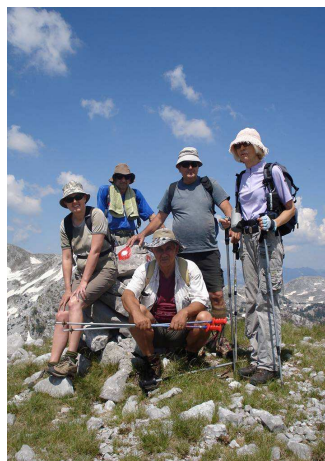
Na vrhu Viljenice

Nakon 1h dolazimo do velike bistjerne, a tu je odmah iznad i katun Radan. Staza je sa katuna markirana ali smo je mi u startu promašili, no nakon pola sata smo se ipak našli na stazi ispod Male Viljenice, a tu su i prvi smetovi zaostalog snijega (16.06.) koji nas prate sve do ispod sjeverne strane Velike Viljenice. Odavde stazom možete produžiti i osvojiti Pločnik ili se spustiti do katuna Kockog i produžiti preko Velike Radeče do Korita.