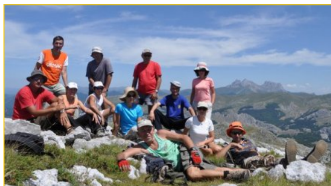
Uspon na Treskavac, "Dani Gorice"