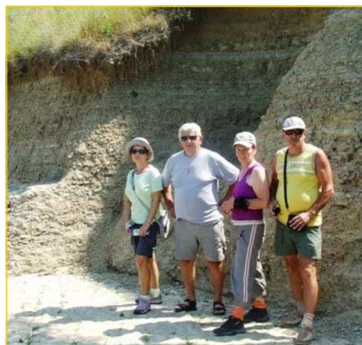
Posjeta dolini Bosanskih piramida kod Visokog

Na putu prema Sarajevu, iz znatizlje kad nam se već pružila prilika, svratili smo do „Bosanskih piramida“ kod Visokog i obišli lokalitet piramide Mjeseca, a zatim nastavili put ka Crnoj Gori. Kraći zastanak opet na Rogoju i obavezno svaćanje na čašicu razgovora na „Brankin ranč“ na Goransko. U Podgoricu smo stigli oko 23:00 zadovoljni ovom posjetom planinarima u BiH.