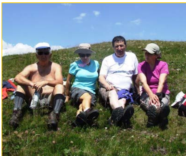
Pod vrhom Zec planine

U Kiseljak iz Podgorice smo doputovali preko Foče i Sarajeva 08. jula oko 15:00, osvježili se u restoranu gdje nas je dočekaio predsjednik društva sa prijateljima, uputio nas kako da dođemo do doma na Pogorelici (pošto je bio radni dan). U dom na Pogorelici pristigli smo u 19:30. Bili smo prijatno iznenađeni izgledom, uređenošću i opremljenošću doma koji je na nivou hotela.