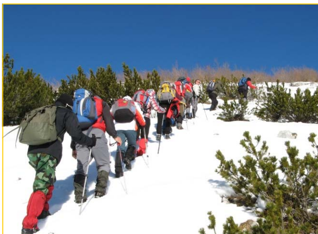
Uspon na Vojnik, januar 2011.

Aktivnosti kluba u 2011. godini Druženje planinara na Platku "Gorica" domaćin 15. susreta planinara Balkana Italijanski i austrijski Alpi Golijska transverzala 2011. Pogorelica Sunčani vrhovi Kopaonika Dođoh da Te nađem